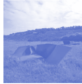
Paul Schöbel DENEMARKE Insh'Allah Staal - 6 x 2 x 0,5 meter en 4 x 3 x 0,25 meter

Zo vormen gevonden en gemaakte vormen een samenhangend beeld.