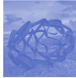
Alphons ter Avest NEDERLAND Sowing the Seeds Staal - 3 x 2 x 2 meter

De locatie is geraffineerd gekozen, gebruikmakend van de steile helling die naar de weg toe ligt. Anders dan de andere beelden ziet dit er toevallig uit. Alsof het zo uit de lucht is komen vallen en bij toeval deze plek toebedeeld heeft gekregen. In werkelijkheid ligt het verankerd aan zware stalen staven.