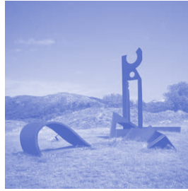
Luciano Dionisi ITALIË La Casa di Mare Staal - 7 x 13 x 8 meter

Het 'huis van de zee' staat op een goedgekozen locatie tegen de rand van het terrein. Het is zo geplaatst dat de verticale vorm, het 'huis', als een duidelijk silhouet afsteekt tegen de rustige achtergrond van lucht, helmgras en groen. Het liggende deel, de zee, gaat fraai op in het landschap.