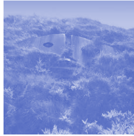
Karl-Heinz Langowsky DUITSLAND Die leeren Augen der Sprachlosigkeit Staal - 7 x 2,5 x 0,1 meter

Als een neergestorte vlieger ligt het stalen beeld van de Duitse kunstenaar Langowsky tegen een duinhelling. Twee rauwe ongelijke driehoeken verbonden door enkele stalen strips vormen samen een gezicht. Door de grote ogen groeit helmgras, waarmee het duin langzaam bezit neemt van het werk. De mond is getekend met stalen repen.